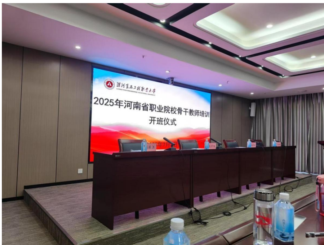
图 2 省级骨干教师培训