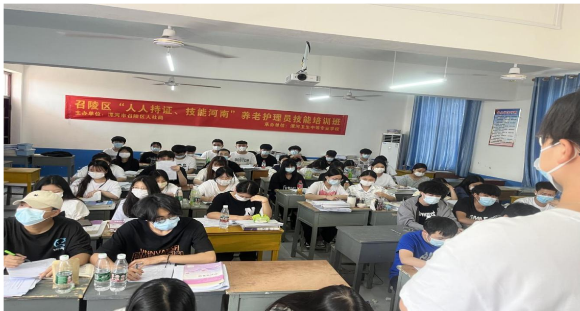
“人人持证、技能河南”理论培训

前培训，细化评分标准，推行“过程评价+结果评价”双重考核机制，确保鉴定工作规范有序。