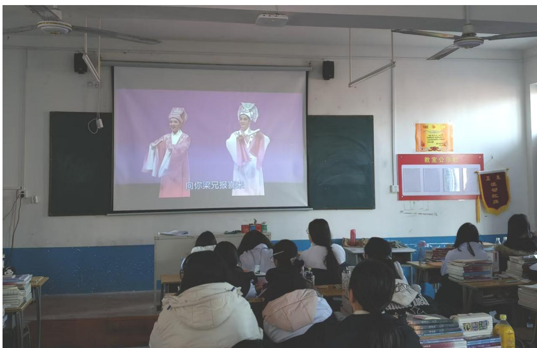
图 3 学生鉴赏传统戏曲