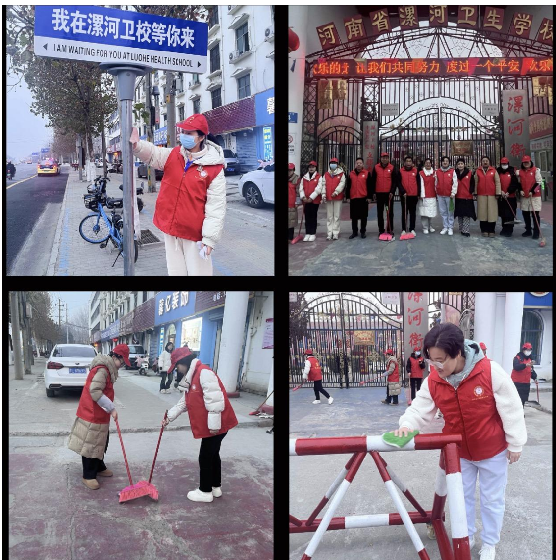
图四 党员教师开展志愿服务活动