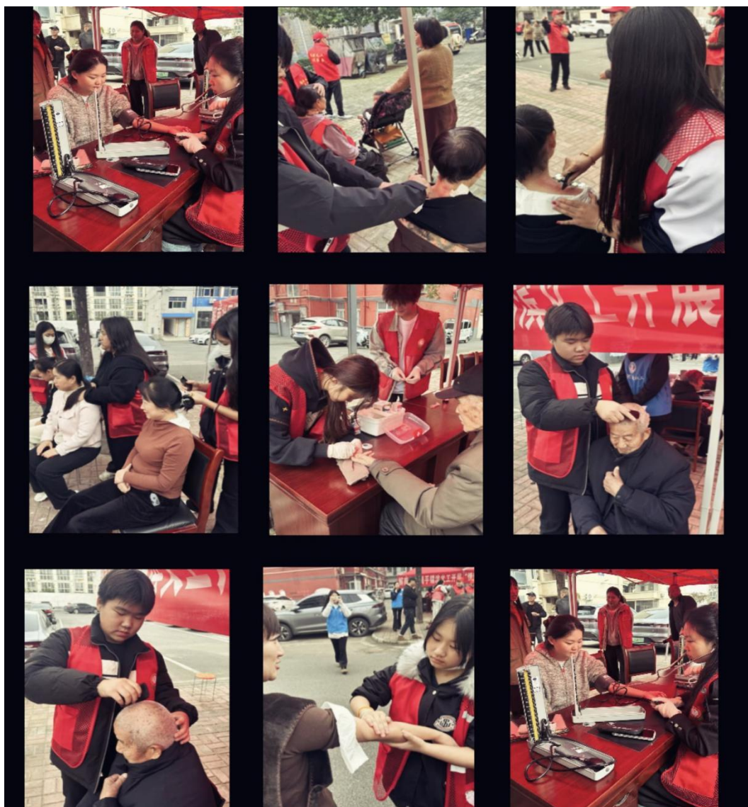
图 1 青年志愿者协会一义诊照片