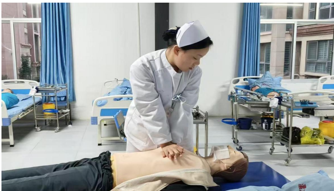
图 2 心肺复苏操作