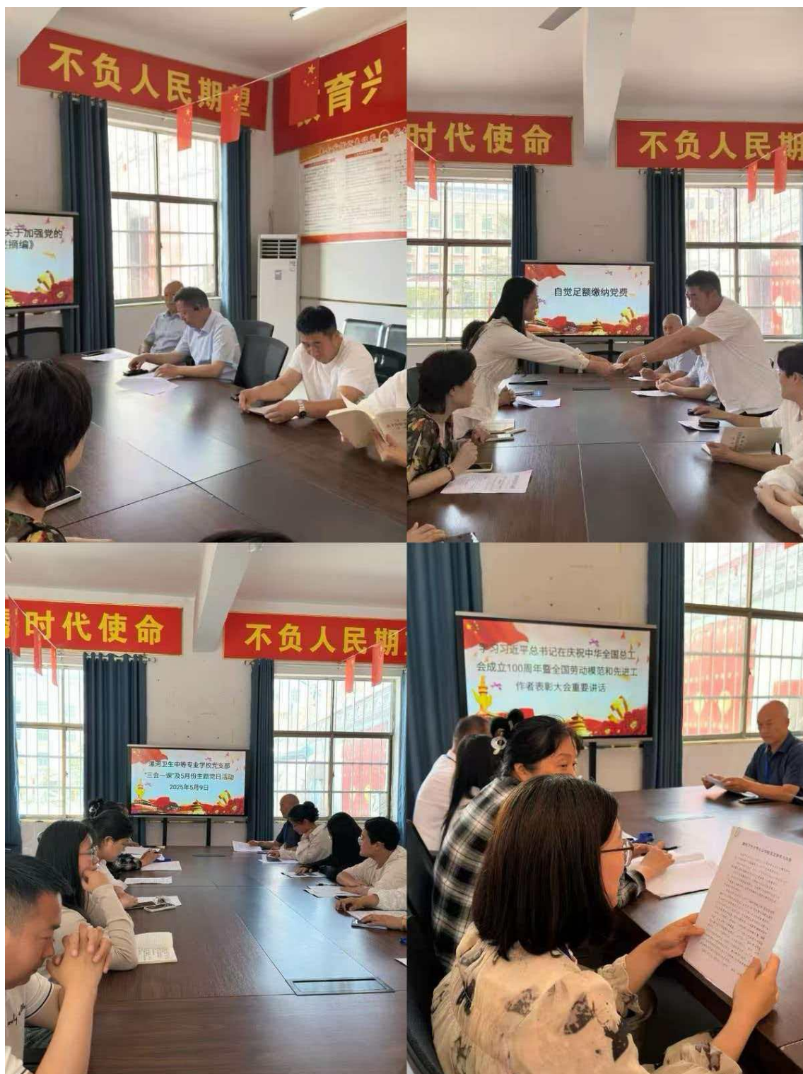
图一 “三会一课” 活动