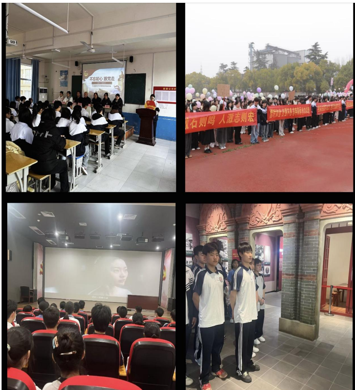
图八 团学系列主题活动形成多元育人格局