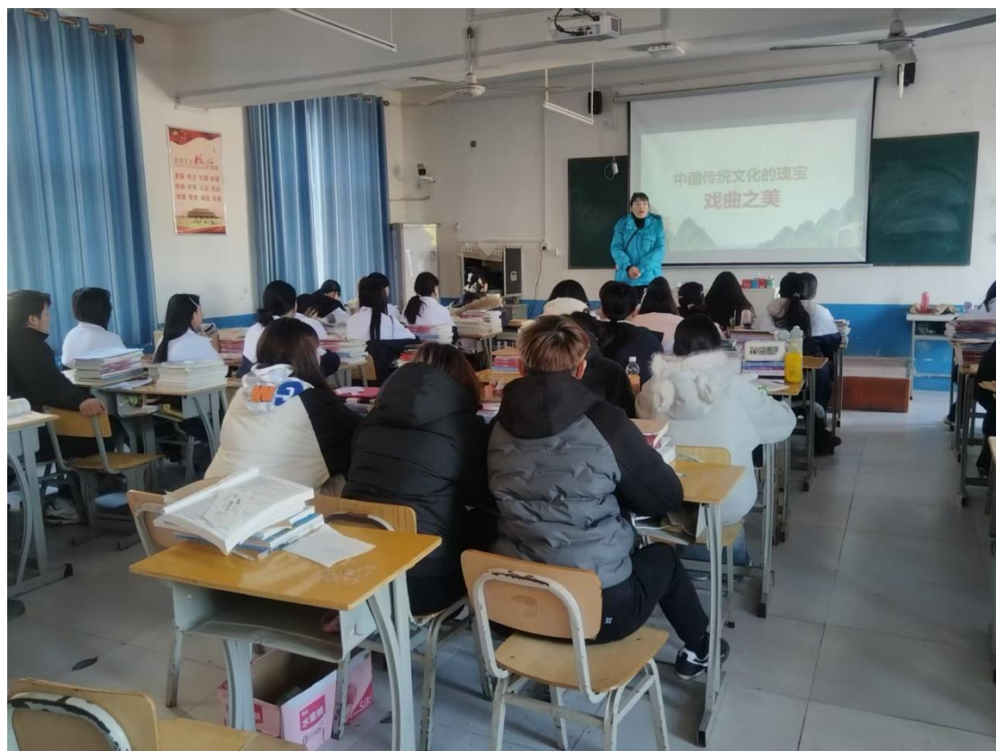
图 2 戏曲进校园

我校通过开设特色课程、组建兴趣社团、举办展演比赛等方式，营造浓厚的文化氛围。让传统艺术在校园扎根，不仅丰富了学生的审美体验，更在潜移默化中厚植文化自信。当青少年与传统艺术相遇，古老的文化便在青春的舞台上焕发崭新的生命力。