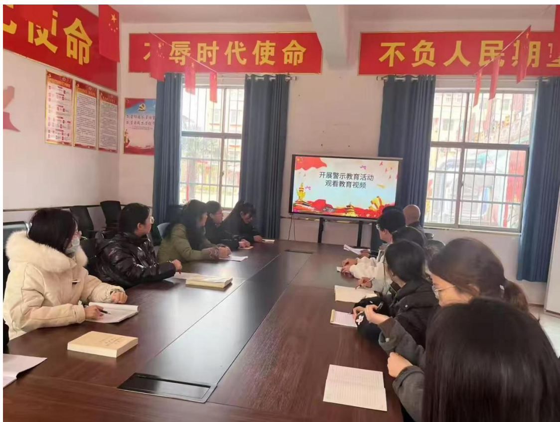
图七 开展警示教育活动

洞。强化监督执纪，畅通举报渠道，对违规行为“零容忍”。推进廉洁文化建设，打造风清气正的育人环境，以优良党风政风带动校风教风学风建设，为教育高质量发展提供坚强纪律保障。