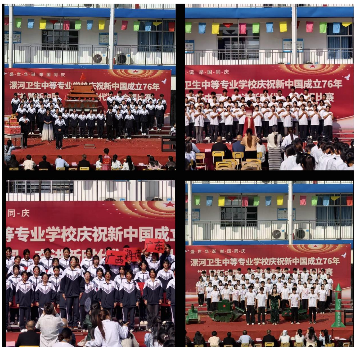
图六 庆祝新中国成立 76 周年合唱比赛