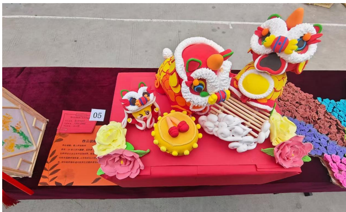
图 1 手工艺术展

学校通过开设国学课程、组织经典诵读、手工制作举办传统节日活动等形式，让传统文化融入学习生活。学生们在书写毛笔字中感悟汉字之美，在学唱京剧中体会艺术之韵，在端午包粽子、中秋赏月等活动中传承民俗文化。