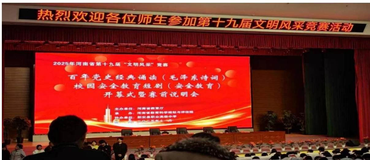
图4 河南省中等职业学校文明风采“校园安全教育短剧”