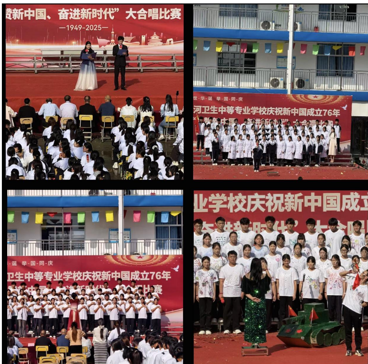
图五 庆祝新中国成立 76 周年合唱比赛

精神风貌。经过激烈角逐，评选出一、二、三等奖及优秀组织奖若干。此次活动不仅丰富了校园文化生活，更激发了师生的民族自豪感与责任感，为新中国成立 76 周年献上了一份饱含深情的贺礼。