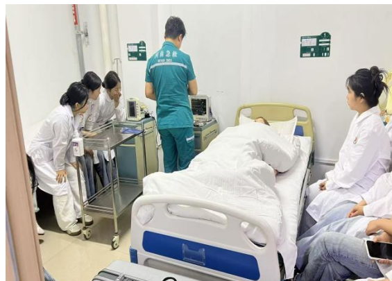
实习学生实践学习