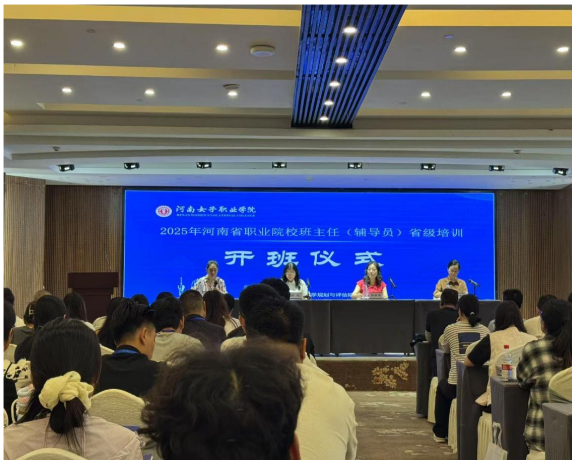
图 1 班主任省级培训

强的专业实践能力和丰富的实际工作经验，逐步达成教师一专多能的目标，着力提高“双师型”教师的占比。大力支持专业教师参与各类职业技能培训，鼓励教师获取职业资格证书，有计划、有组织地安排骨干教师和专业带头人依次参加省级、市级培训。本年度，学校教师的职业技能得到了显著提升。