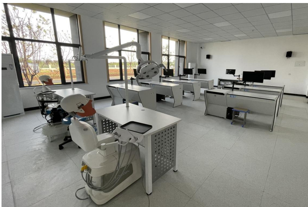
图 2 口腔实训室