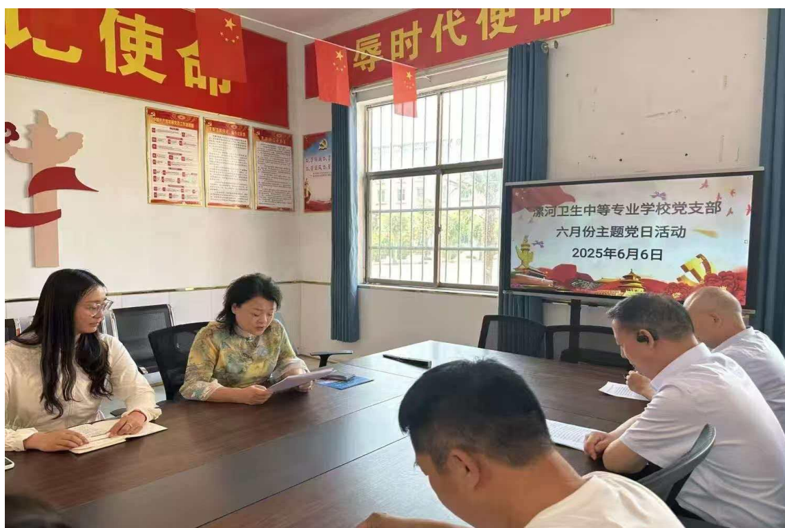
图二 党支部主题党日活动