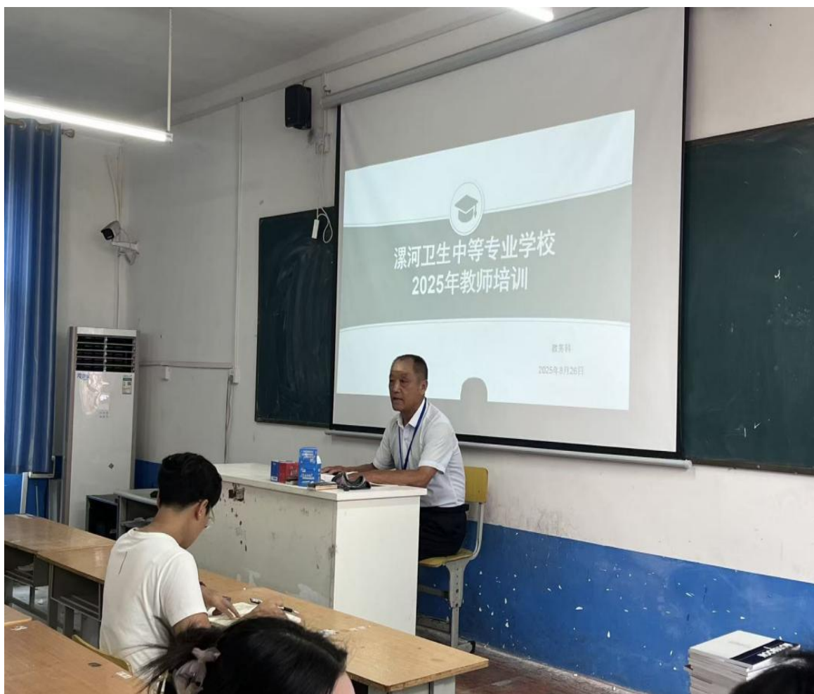
图 1 开展 2025 新学期教师校内岗前培训

学校严格按照河南省教育厅及漯河市教育局关于教师培训工作的部署要求，科学统筹校内外培训资源，扎实推进教师队伍与教职员工队伍素质提升工程。2025 年度，共选派 14 名教师参加省级、市级等各级各类培训，实现参训率 100%的工作目标。