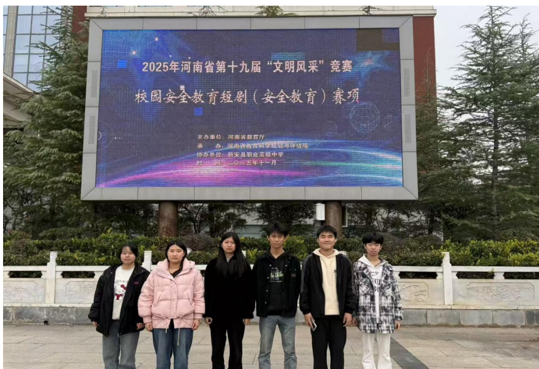
图3 第十九届河南省中等职业学校“文明风采”竞赛 校园安全短剧（安全教育）比赛