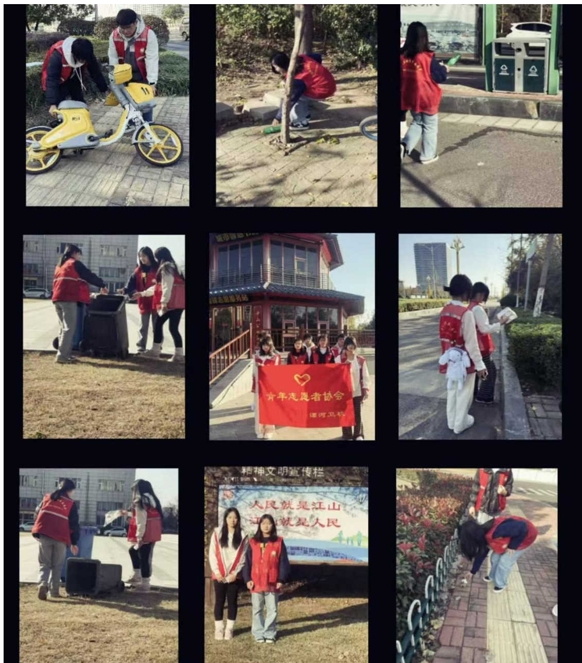
图 2 青年志愿者协会一清扫活动

此次活动，不仅美化了公园环境，也增强了市民环保意识。未来我们将继续开展类似活动，带动更多人参与环保行动，为建设美丽城市贡献力量。