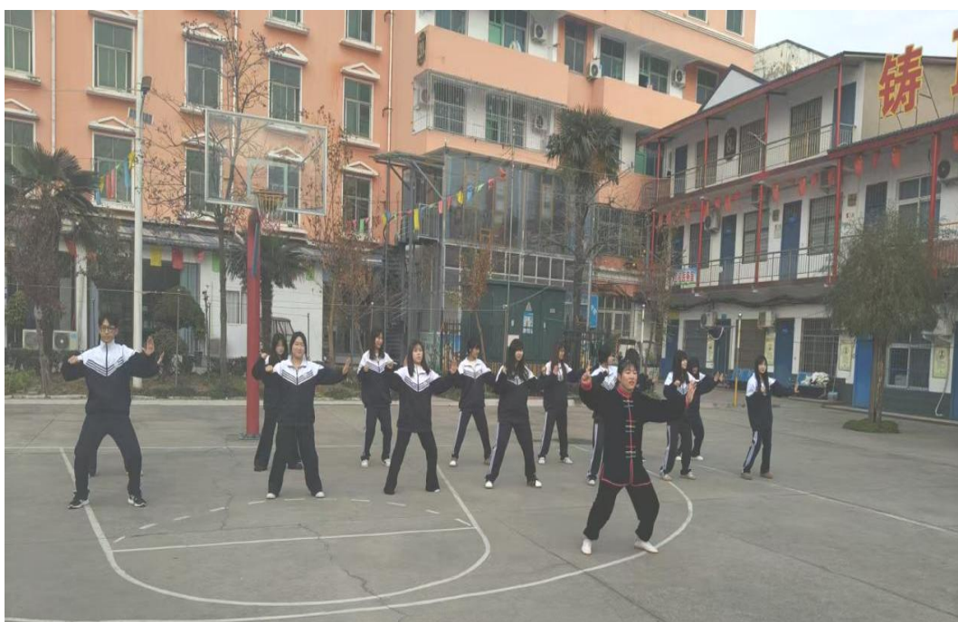
图 4 校园太极课