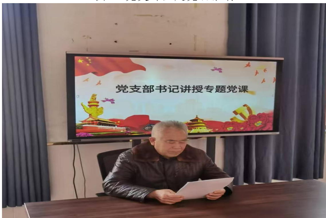
图三 党支部书记讲党课