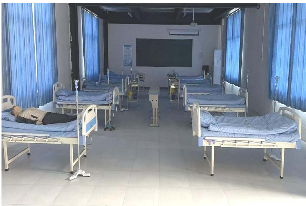
图 1 护理实训室