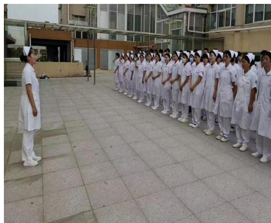
实习学生岗前培训