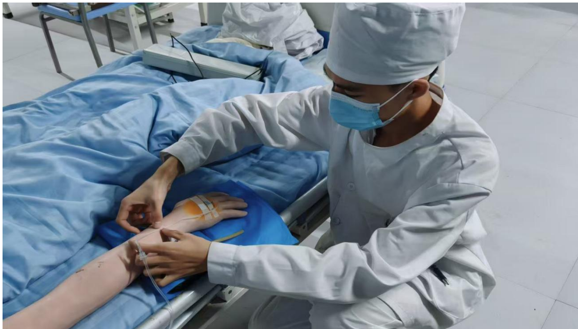
图 1 静脉输液操作

职业教育文明风采市级评选中获一等奖 6 项、二等奖 31 项、三等奖 12 项。