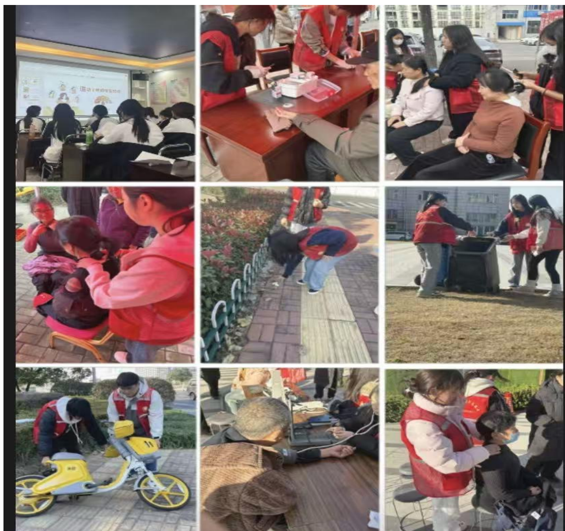
图九 开展志愿服务活动

员，深入社区、乡村，开展政策解读、义务义诊、环境整治、爱心帮扶等便民服务。大家以实际行动倾听群众呼声、解决急难愁盼，用脚步丈量民情，用实干赢得民心。此次活动将党建工作与志愿服务深度融合，既彰显了党员的责任担当，又架起了党群“连心桥”，切实增强了群众的获得感与幸福感。